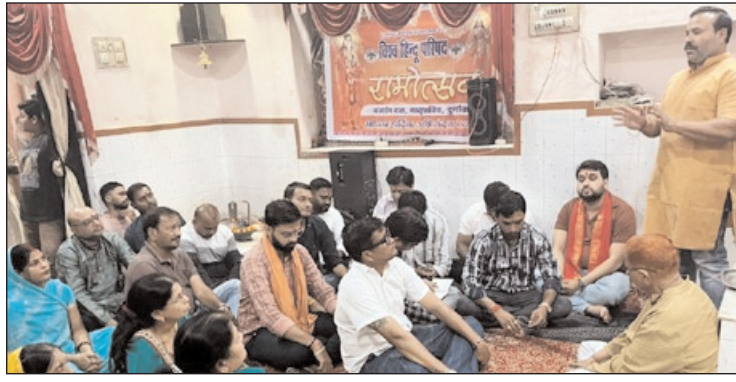
अंतर्गत आयोजित किया जा रहा है। कार्यक्रम पूजा-अर्चना कर भगवान श्रीराम के आदर्शों को जन-जन तक पहुंचाने तथा सनातन धर्म के दौरान रामदत्तार के छायाचित्र की विधिवत

जानकारी के अनुसार यह आयोजन 19 मार्च हिंदू नववर्ष से प्रारंभ होकर 2 अप्रैल हनुमान जन्मोत्सव तक चलाया जा रहा है। यह कार्यक्रम विश्व हिंदू परिषद-बजरंग दल की राष्ट्रीय स्तर की बैठक में तय कार्ययोजना के