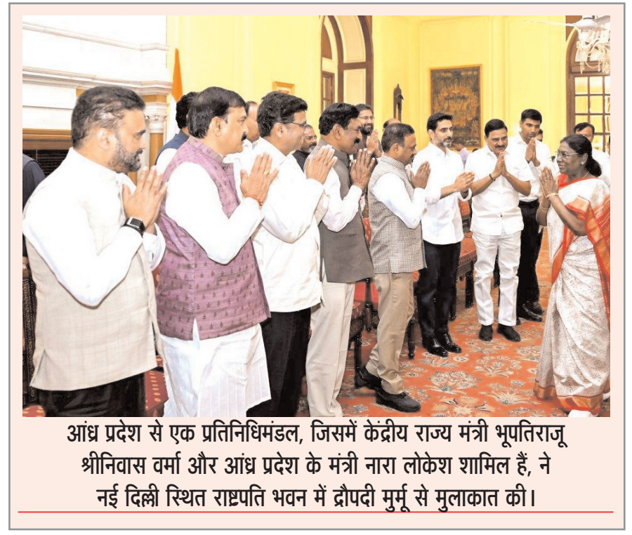
आंध्र प्रदेश से एक प्रतिनिधिमंडल, जिसमें केंद्रीय राज्य मंत्री भूपतिराजू श्रीनिवास वर्मा और आंध्र प्रदेश के मंत्री नारा लोकेश शामिल हैं, ने नई दिल्ली स्थित राष्ट्रपति भवन में द्रौपदी मुर्मू से मुलाकात की।

करता है। होमोज का खुला, सुरक्षित और सुलभ रहना पूरी दुनिया के लिए आवश्यक है। हमने शांति और स्थिरता के प्रयासों के संबंध में संपर्क में रहने पर सहमत जताई। पीएम मोदी ने एक्स पर पोस्ट करते हुए लिखा कि मुझे मेरे मित्र अमेरिका के राष्ट्रपति ट्रंप का फोन आया।