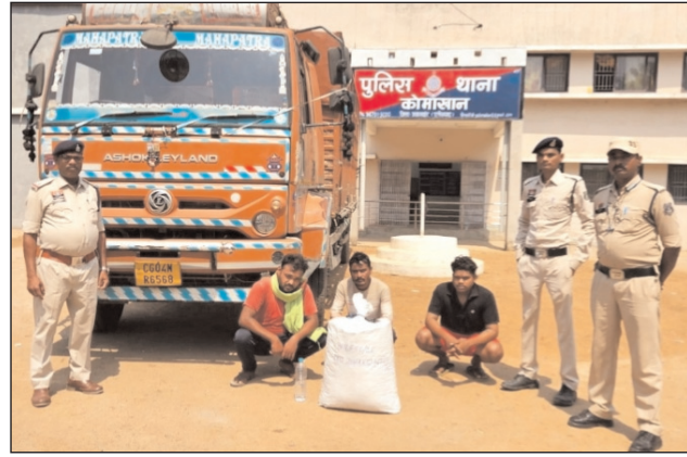
सामान के बारे में इनसे पुछताछ की हूए गांजा तस्करी की बात कबूल तो दोनों ने अपना जुर्म कबूल करते लि और बताया की गांजा को

महासमुन्द (समय दर्शन)। जिले भर के सभी थानों को अवैध मादक पदार्थ गांजा की तस्करी तथा इंड टू इंड एवं फ़इनेशियल इनवेस्टिगेशन, सोर्स च्वाइट, डेस्टिनेशन च्वाइट पर प्रभावी एवं विधिवत कार्यवाही करने के लिए निर्देशित किया गया है जिसपर जिले में पुलिस के द्वारा लगातार चेंकिंग कार्यवाही की जा रही है इसी दरमियान कोमाखान पुलिस को सूचना मिली की एक कत्था रंग की साह्य स्थलुखुखु आईचर ट्रक क्रमांक एच 04 हक्र 6568 में भारी मात्रा पर गांजा परिवहन किया जा रहा है।