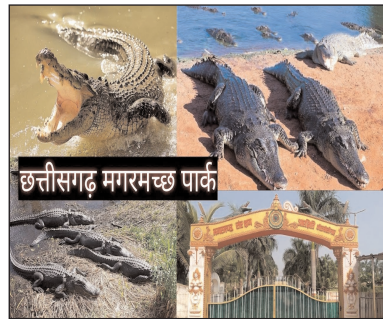
छत्तीसगढ़ मगरमच्छ पार्क

मगरमच्छ की सभी प्रजातियाँ लुप्तप्राय नहीं हैं, लेकिन कुछ प्रजातियों की आबादी बहुत कम हो जाने के कारण, उनके प्रबंधन और सुरक्षात्मक कानूनों की आवश्यकता है। मगरमच्छ संरक्षण परियोजना भारत में वन्यजीव (संरक्षण) अधिनियम, 1972 भारत सरकार द्वारा शुरू की गई थी। इसका प्रमुख उद्देश्य प्राकृतिक आवासों की रक्षा करना, कैप्टिव ब्रीडिंग के माध्यम से मगरमच्छों की संख्या को बढ़ावा देना और प्राकृतिक वातावरण में नवजात शिशु के जीवित रहने की कम दर का समाधान करना है।