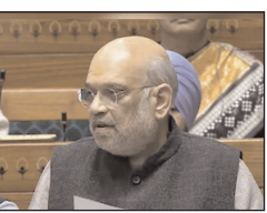
हम भी उन्हें सदन में बोलने नहीं देंगे। विपक्ष के वॉकआउट पर गिरिराज सिंह ने कहा, राहुल गांधी हिट-एंड-रन वाला तरीका अपनाते हैं। जब प्रधानमंत्री और गृह मंत्री सदन में बोलते हैं, तो वह बाहर चले जाते हैं। लोकतंत्र को लेकर यही उनकी सोच है। उनमें सच सुनने की ताकत नहीं है। गृहमंत्री के बयान

नई दिल्ली (एजेंसी)। लोकसभा में केंद्रीय गृह मंत्री अमित शाह के भाषण के बीच विपक्षी दलों के वॉकआउट पर भारतीय जनता पार्टी (भाजपा) हमलावर है। गुरुवार को केंद्रीय मंत्री और भाजपा सांसदों ने आरोप लगाया कि राहुल गांधी हिट-एंड-रन वाला तरीका अपनाते हैं। केंद्रीय मंत्री गिरिराज सिंह ने गुरुवार को संसद परिसर में मीडिया के सवालों का जवाब देते हुए कहा कि लोकसभा में नेता प्रतिपक्ष राहुल गांधी को अपनी आदत छोड़नी पड़ेगी। अगर वह बात नहीं सुनेंगे तो अगली बार