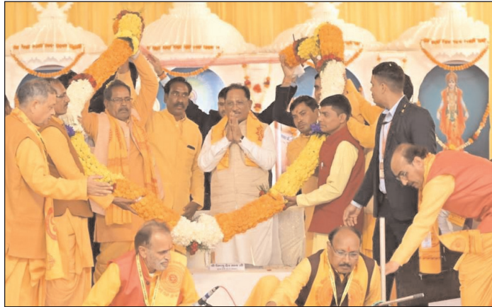
प्रधानमंत्री श्री नरेंद्र मोदी के नेतृत्व में सनातन संस्कृति को विश्व पटल पर नई पहचान मिली है। उन्होंने कहा—500 वर्षों के बाद अयोध्या में भव्य श्रीराम मंदिर का निर्माण हुआ, काशी विश्वनाथ धाम का कार्यालय हुआ। छत्तीसगढ़ तो स्वयं

रायपुर (समय दर्शन)। मुख्यमंत्री विष्णुदेव साय सक्ती जिले के ग्राम हसौद में आयोजित भव्य 251 कुण्डीय गायत्री महायज्ञ में शामिल हुए। मुख्यमंत्री ने इस आयोजन को आध्यात्मिक एकता, सामाजिक सद्भाव और सांस्कृतिक गौरव का अद्भुत संगम बताया। उन्होंने कहा कि मां महामाया की पावन भूमि हसौद में 251 कुण्डों में एक साथ सम्पन्न हो रहा यह महायज्ञ छत्तीसगढ़ की आध्यात्मिक परंपरा को नई ऊंचाई देता है। मुख्यमंत्री श्री साय ने कहा कि