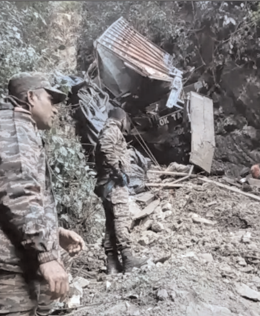
से मुश्किल से बाहर निकला और हयुलियांग-चंगलगांग रोड पर पहुंचा। दो दिन तक पैदल चलकर दिसंबर की रात चिपरा त्रभ्रन्न कैंप तक पहुंचा। यहां उसने जवानों को हादसे की जानकारी दी। इसके बाद गुरुवार सुबह आर्मी ने रेस्क्यू ऑपरेशन शुरू किया। हादसे वाली जगह चंगलगांग से लगभग 12 किलोमीटर आगे पहाड़ी और घने

अरुणाचल प्रदेश (एजेंसी)। अरुणाचल प्रदेश के अनर्जा जिले के हयुलियांग इलाके में एक ट्रक 1000 फीट गहरी खाई में गिर गया। इस हादसे में ड्राइवर और क्लीनर समेत 21 की मौत हो गई। बचाव दल को 18 शव मिल चुके हैं। यह हादसा 8 दिसंबर का है। जानकारी गुरुवार को सामने आई। दरअसल, हादसे में एक व्यक्ति जीवित बचा था, जो दो दिन तक पैदल चलकर किसी तरह आर्मी कैंप पहुंचा। इसके बाद आज सुबह आर्मी के बचाव दल की टीमों मौके पर पहुंचीं। टीम को घटनास्थल पर पहुंचने में 10 से ज्यादा घंटे लगे। हादसे में घायल व्यक्ति खाई