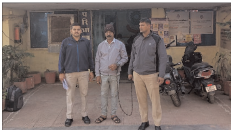
रही है। उसने गूगल पे और अकाउंट पे के माध्यम से भी ?18 लाख दिए थे।

साल 2022 से 2024 के बीच आरोपी ने जरूरी खर्च और अन्य जरूरतों का हवाला देकर किरातों में और कैश के रूप में कुल 32 लाख रुपए लिए। चौकाने वाली बात यह है कि महिला ने यह पूरी रकम बैंक और गोल्ड लोन (21.30 लाख) लेकर आरोपी को दी। वह अब भी इन सभी लोन की किरतें अकेले चुका