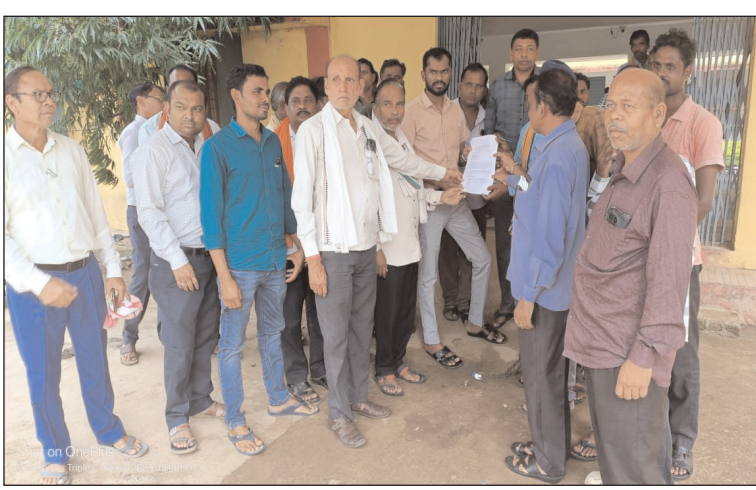
किसानों को घुमाया जा रहा है। अतः माननीय मुख्यमंत्री जी से प्रदेश के शोषित, पीड़ित किसानों की मांग है कि किसानों के प्रदेश में किसानों का शोषण बंद होना चाहिए एवं उनकी समस्याओं का तत्काल निराकरण हो। यदि किसानों को तत्काल राहत नहीं मिली तो भारतीय किसान संघ बड़े आंदोलन के लिए बाध्य होगा।

बसना (समय दर्शन)। किसान आज प्रदेश में खाद, बिजली, पानी की समस्या को लेकर बहुत व्यथित है। प्रदेश में ये तीनों समस्याएं विकराल रूप धारण करते जा रही हैं। खाद के लिए प्रदेश में मारामारी हो रही है। किसान खाद महंगे दामों में लेने हेतु विवश हो गया है। बिजली कटौती से किसान त्रस्त है। नहरों का पानी अंतिम गांवों तक पहुंच नहीं पाया है, ऐसे में छत्तीसगढ़ का किसान खेती कैसे कर पायेगा चिंता में हैं ?