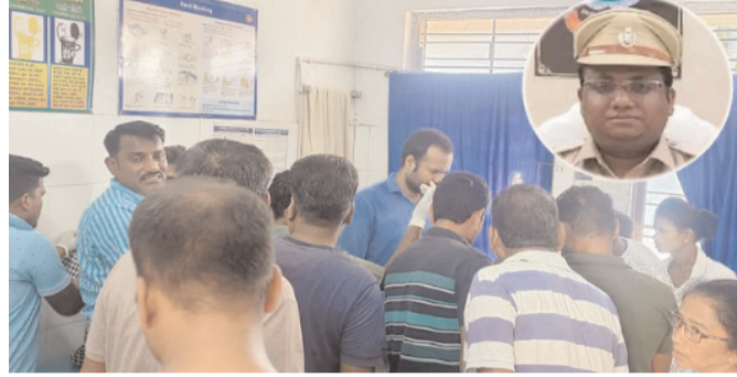
आला अधिकारियों ने बताया कि बसवराजू जवानों ने 21 मई को मार गिराया था, जिसके बाद से बौखलाए नक्सलियों के साथ ही 28 नक्सलियों को पुलिस के

एएसपी से लेकर एसडीओपी व थाना प्रभारी के साथ ही टीम किया गया था रवाना