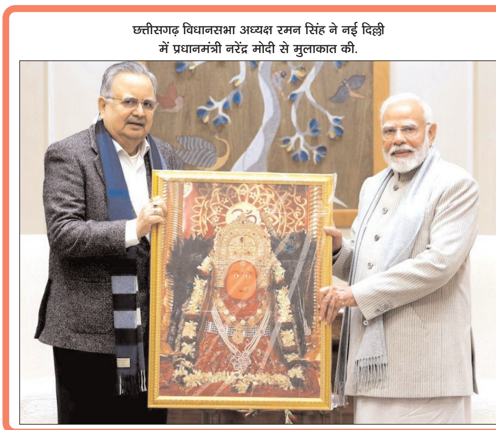
छत्तीसगढ़ विधानसभा अध्यक्ष रमन सिंह ने नई दिल्ली में प्रधानमंत्री नरेंद्र मोदी से मुलाकात की।