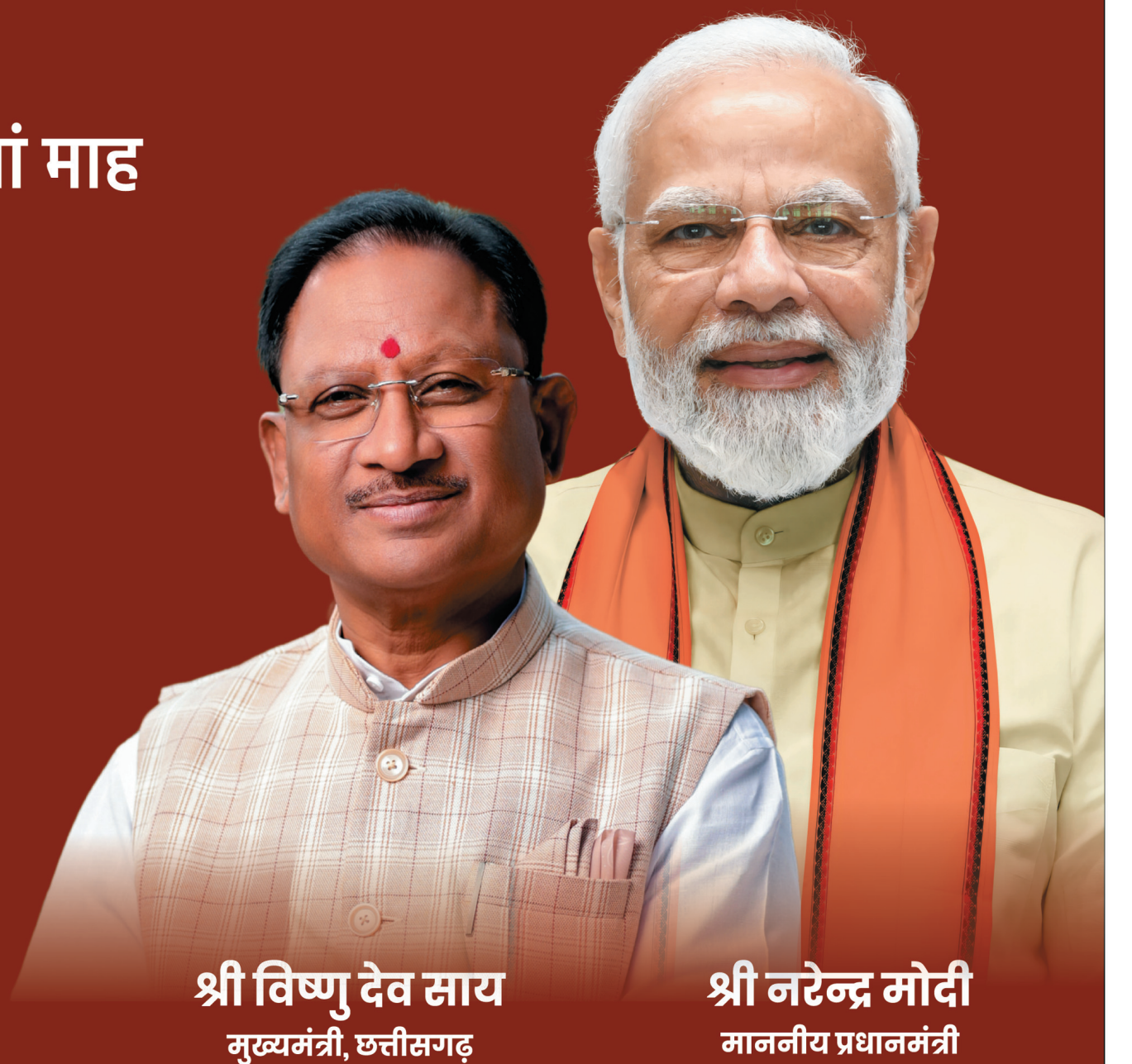
श्री विष्णु देव साय मुख्यमंत्री, छत्तीसगढ़

मुख्यमंत्री विष्णु देव साय से जुड़ने के लिए QR CODE स्कैन करें