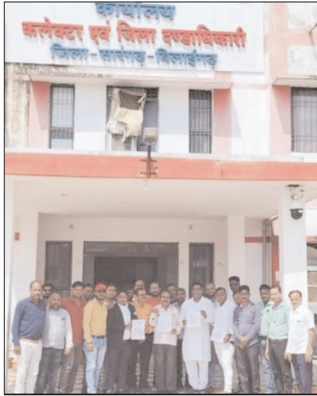
इससे वंचित पाता है। छत्तीसगढ़ श्रमजीवी पत्रकार संघ आपके समक्ष निम्नांकित मांग रखकर उसे पूरा करने की

उक्त ज्ञापन पत्र में छत्तीसगढ़ राज्य अब अपनी युवावस्था का 25 वर्ष पूरा करने जा रहा है। छत्तीसगढ़ राज्य साधनों एवं सुविधाओं से परिपूर्ण है जिससे समाज का हर वर्ग विकास की राह में अग्रसर है किन्तु समाज को दिशा देकर प्रजातंत्र में अपनी महती भूमिका निभाने वाला श्रमजीवी पत्रकार अपने आप को