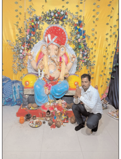
नव युवा गणेश उत्सव समिति वार्ड नं 09, अहिवारा