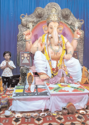
सार्वजनिक गणेश उत्सव समिति नदिनी टाऊनशिप मार्केट