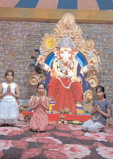
सिध्दी विनायक गणेश उत्सव समिति नदिनी टाऊनशिप मार्केट