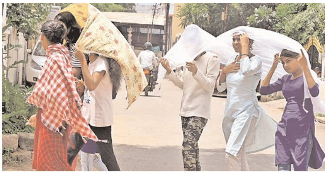
तेज धूप और भीषण गर्मी पड़ सकती है। गर्म हवाओं के चलने से तापमान में वृद्धि हो रही है। आगामी दिनों में भीषण गर्मी पड़ सकती है। हालांकि अभी 2 से 3 डिग्री ही तापमान में बढ़ोतरी होगी। प्रदेश में सर्वाधिक अधिकतम तापमान 34 डिग्री सेल्सियस तिलदा में दर्ज किया गया है। वहीं सबसे कम न्यूनतम तापमान 20.6 डिग्री सेल्सियस नारायणपुर में दर्ज किया गया है। राजधानी रायपुर में सुबह से ही धूप खिली हुई है। यहां अधिकतम तापमान 39.8 डिग्री सेल्सियस किया गया है। न्यूनतम तापमान 25 डिग्री सेल्सियस रहा।

रायपुर(समय दर्शन)। छत्तीसगढ़ में इन दिनों मौसम साफ हो गया है। सुबह से ही तेज धूप निकली है। तापमान में भी बढ़ोतरी हुई है। इस बीच एक बार फिर भीषण गर्मी पड़ रही है। लोग तेज धूप और गर्मी से परेशान हो गए हैं। प्रदेश में तापमान 43 डिग्री तक पहुंच चुका है। सबसे गर्म तिलदा रहा है। मौसम विभाग के अनुसार, प्रदेश में अगले तीन दिनों में अधिकतम तापमान में 2 से 3 डिग्री सेल्सियस बढ़ने की संभावना है। इसके बाद तापमान में कोई विशेष परिवर्तन होने की संभावना नहीं है। मौसम एक्सपर्ट का कहना है कि एक द्रोणिका पूर्वी बिहार और उसके आसपास स्थित चक्रवर्ती परिसंचरण से झारखंड और ओडिशा होते हुए दक्षिण छत्तीसगढ़ तक औसत समुद्र तल से 0.9 किलोमीटर पर स्थित है। द्रोणिका के प्रभाव से दक्षिण छत्तीसगढ़ में मौसम शुष्क रहने की संभावना है। साथ ही अन्य जगहों पर