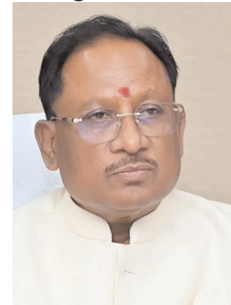
स्ट्राइक को काल्पनिक कहा था। यह घटना तो उनके ही प्रदेश की है, कैसे उस पर सवाल उठा सकते हैं। यह घटना अगर फर्जी है तो प्रमाणित करें, सबूत दें। बता दें कि पूर्व सीएम भूपेश बघेल ने कवर्धा में नक्सलियों को लेकर बड़ा बयान दिया था। पूर्व सीएम ने कहा था कि भाजपा सरकार में फर्जी एनकाउंटर होते रहे हैं। छत्तीसगढ़ के आदिवासियों को डरा धमका कर गिरफ्तार किया जा रहा है। पिछले 4 महीने से डरा धमका कर गिरफ्तार किया जा रहा है। कवर्धा जिले में भी डराया धमकाया जा रहा है। प्रेस वार्ता में नक्सली मुठभेड़ को लेकर भूपेश बघेल से सवाल किया गया था।

रायपुर(समय दर्शन)। कांकिर में सुरक्षा बलों और नक्सली मुठभेड़ में मिली सफलता तथा पूर्व सीएम के बयान पर मुख्यमंत्री विष्णु देव साय का बयान सामने आया है। सीएम श्री साय ने कहा कि ये बहुत बड़ी उपलब्धि है। कांकिर के जंगल में जवानों और नक्सलियों के बीच में मुठभेड़ हुई। यह ऐतिहासिक सफलता है, अब तक की सबसे बड़ी सफलता है। जवानों को बधाई देता हूं, छत्तीसगढ़ के इतिहास में सबसे बड़ी सफलता है। सीएम ने कहा कि माओवादी लोकसभा चुनाव को प्रभावित करने के उद्देश्य में थे। इस बार बड़ी वारदात को कोशिश में थे, जिसे जवानों ने नाकाम कर दिया। केंद्रीय गृह मंत्री अमित शाह का लक्ष्य है कि बस्तर नक्सल मुक्त हो। नक्सलियों से वार्ता को लेकर सीएम विष्णुदेव साय का बड़ा बयान सामने आया है। सीएम ने कहा कि बार बार हमारे गृह मंत्री बोल चुके चाहता हूं शांति वार्ता के लिए हम तैयार हैं। उनके साथ भी न्याय किया जाएगा। वहीं कवर्धा में दिए पूर्व सीएम भूपेश बघेल के बयान पर सीएम विष्णुदेव साय ने कहा कि हर चीज में प्रश्न चिन्ह खड़ा करना ठीक बात नहीं है। सर्जिकल