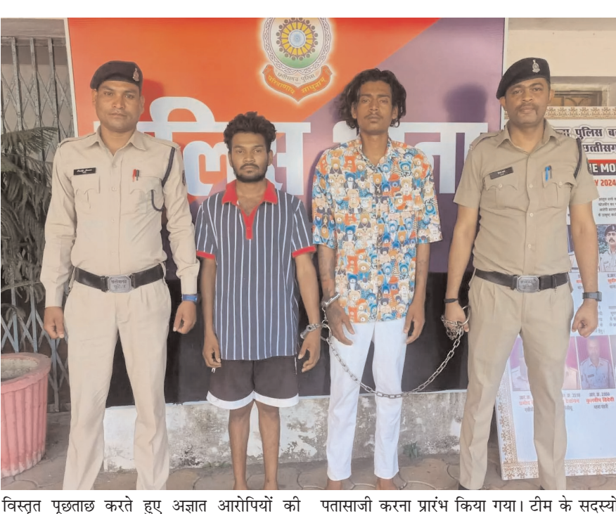
विवृत पृच्छाछ करते हुए अज्ञात आरोपियों की पतासाजी करना प्रारंभ किया गया। टीम के सदस्यों